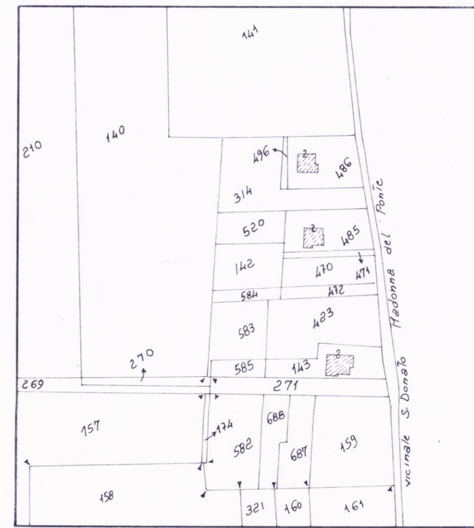
FOGLIO n. 194 PART. n. 314 n. 520 n. 142/rata