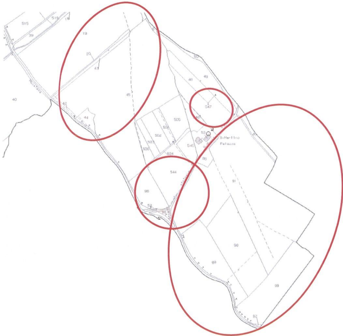
Fig. 188 part. 21, 42, 43, 44, 45, 52, 86, 87, 88, 89, 90, 91, 92, 96, 99, 544, 547;